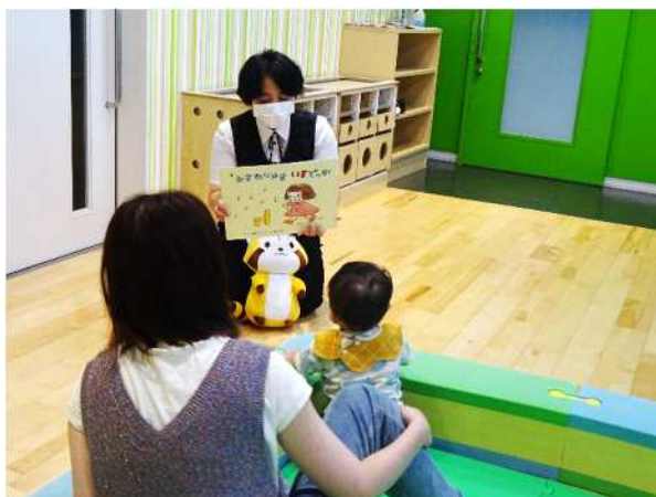
おはなしのバスケットの様子