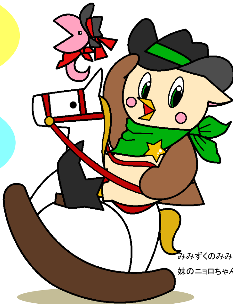
みみずくのみみちゃんと 妹のニヨロちゃん