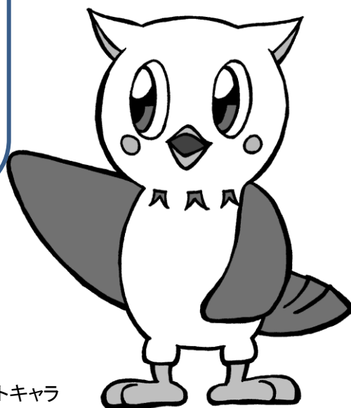
図書館マスコットキャラ みみずくの「みみちゃん」

戸田市立図書館 出前講座担当 〒335-0021 戸田市大字新曽 1707 TEL/ 048-442-2800 FAX/ 048-442-8988 E-Mail / tosyokan@city.toda.saitama.jp