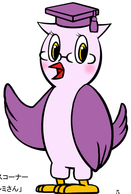
図書館レファレンスコーナー マスコットキャラ「レミさん」

はい。子供だけのグループで受講 できます。 申込等の手続は保護者が代表者と なって行ってください。