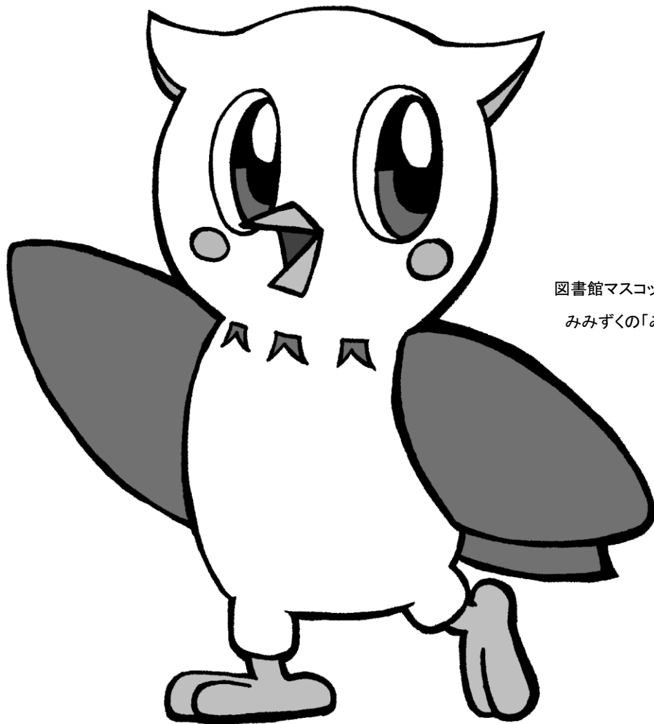
図書館マスコットキャラ みみずくの「みみちゃん」